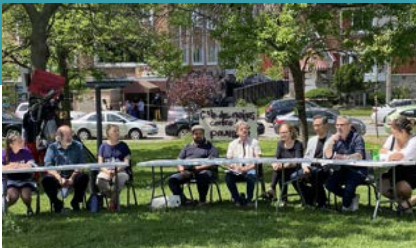
PHOTO: JOURNÉE D'ACTION CONTRE LA PAUVRETÉ À CÔTE-DES-NEIGES