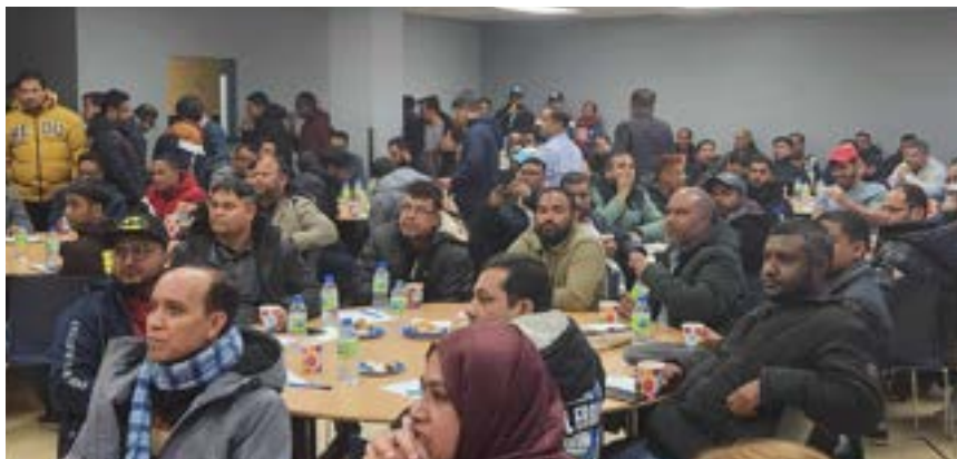
PHOTO : ATELIER CONNAISSEZ VOS DROITS, AVEC LE BANGLADESH SOCIO-CULTURAL FORUM, AVRIL 2024

Nous participons également à des réseaux Québécois : la Coalition pour l'accessibilité aux services des CLEs (CASC), le Front d'action populaire en réaménagement urbain (FRAPRU), et le Regroupement des comités logement et associations de locataires du Québec (RCLALQ). En outre, nous sommes membres de la Coalition pour le maintien dans la communauté (COMACO), du Réseau d'aide aux personnes seules et itinérantes (RAPSIM), de la Table de concertation des organismes au service des personnes réfugiées et immigrantes (TCRI), et de la Table régionale des organismes volontaires d'éducation populaire (TROVEP).