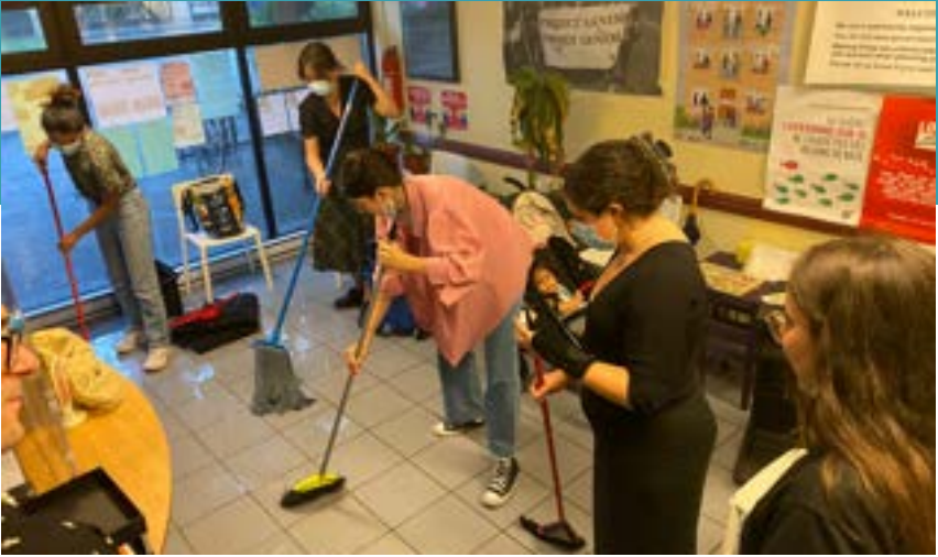
PHOTO : LES BÉNÉVOLES ET LE PERSONNEL NETTOIENT APRÈS UNE INONDATION