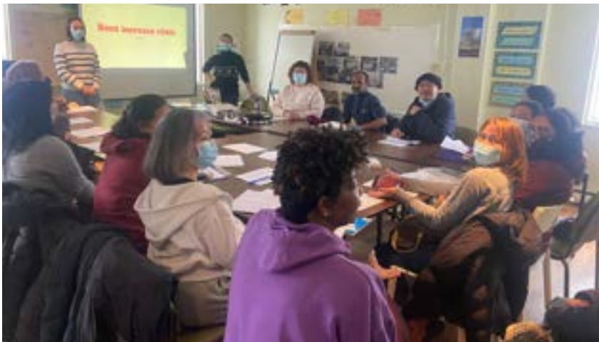
PHOTO : CLINIQUE SUR LES AUGMENTATIONS DE LOYER

En plus des cliniques organisées à Projet Genèse, nous avons organisé une clinique au centre communautaire Mountain Sights. Ce partenariat a été fructueux et nous prévoyons de nous appuyer sur ce modèle en organisant des cliniques dans d'autres centres communautaires au cours de l'année à venir.