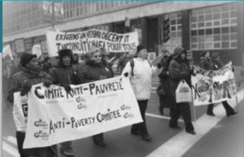
PHOTO : LES MEMBRES DE PROJET GENÈSE AVEC LES BANNIÈRES DES COMITÉS ANTI-PAUVRETÉ ET DROIT AU LOGEMENT DANS UN MANIFESTATION